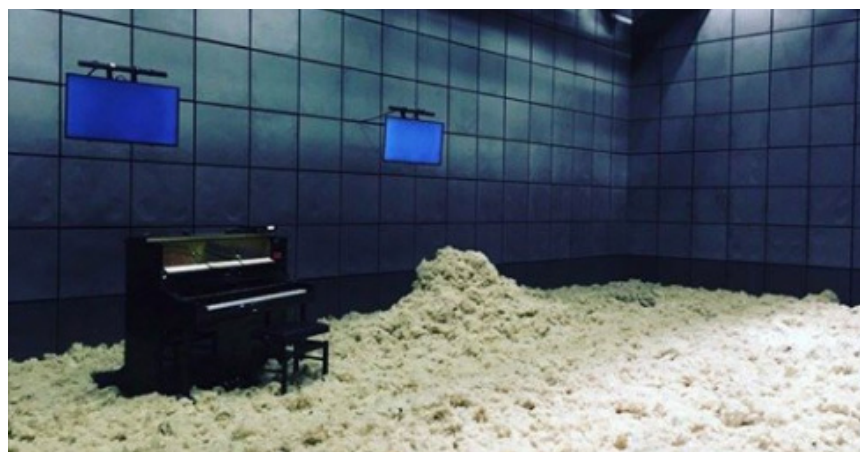
For Morton Feldman, photo de plateau, Gaîté Lyrique 2018.

> 04 avril 2019 : Vivat Armentières (coréalisation / Opéra de Lille )